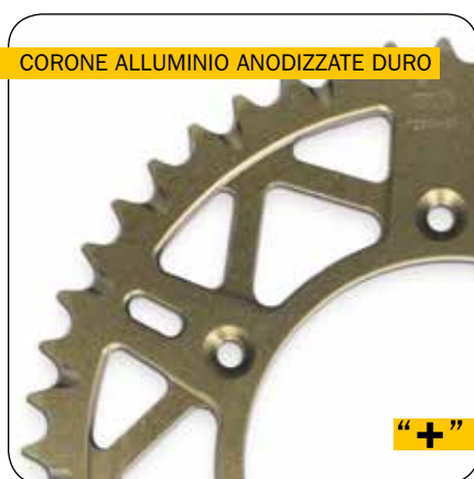
CORONE ALLUMINIO ANODIZZATE DURO