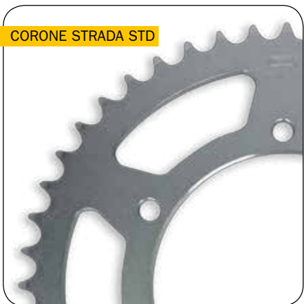
CORONE STRADA STD