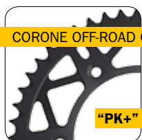
CORONE OFF-ROAD COLORATE

In questo ultimo caso sono stati ricavati degli scarichi posizionati nella gola del dente per permettere l'espulsione del materiale trascinato dalla catena in modo da mantenere pulito l'ingranaggio in presenza di accumuli di fango.